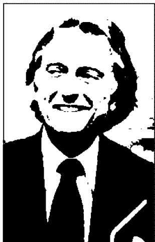
L. Cordero di Montezemolo

Servirà 9 città il supertreno di Montezemolo e Della Valle. Nella compagine di Ntv anche le Generali